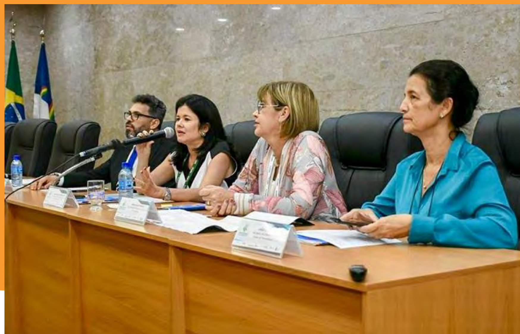
Ministério da Transparência, Fiscalização e Controladoria-Geral da União (CGU), Conselho Federal de Contabilidade (CFC) e Conselho Regional de Contabilidade em Pernambuco (CRC-PE)