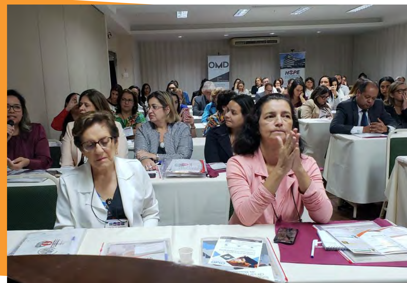
Associação Brasileira de Ouvidores (ABO-PE)