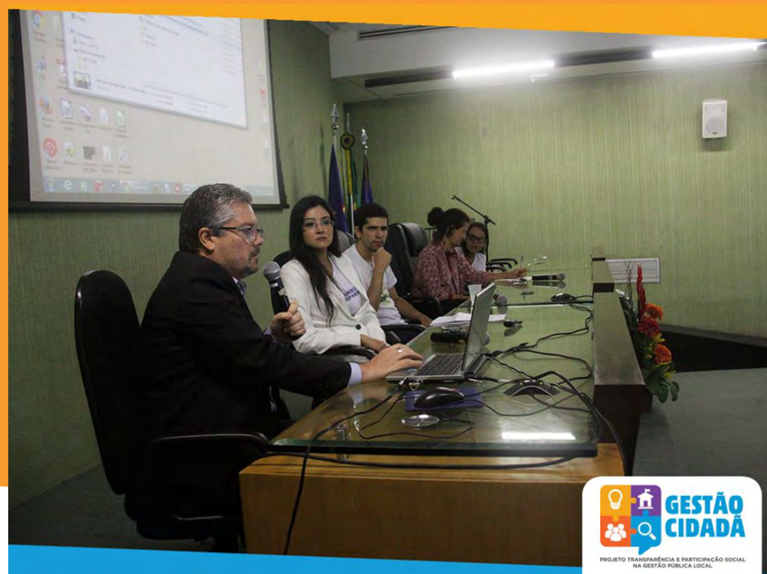
Fórum Permanente de Combate à Corrupção em Pernambuco (Focco-PE)