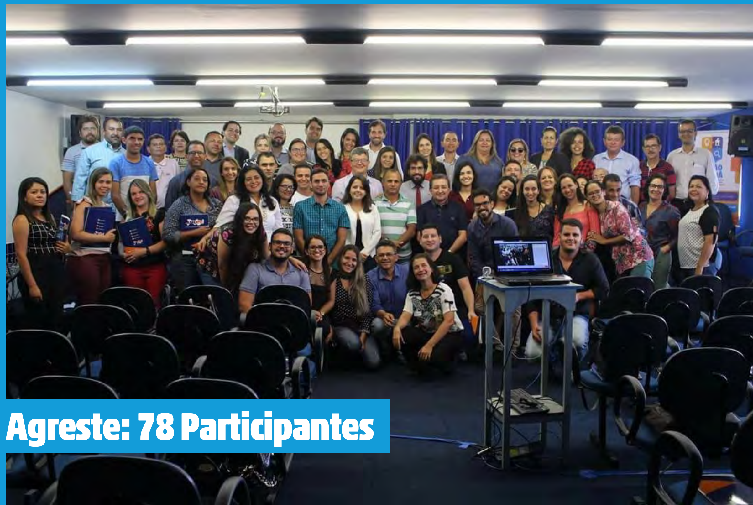
Agreste: 78 Participantes