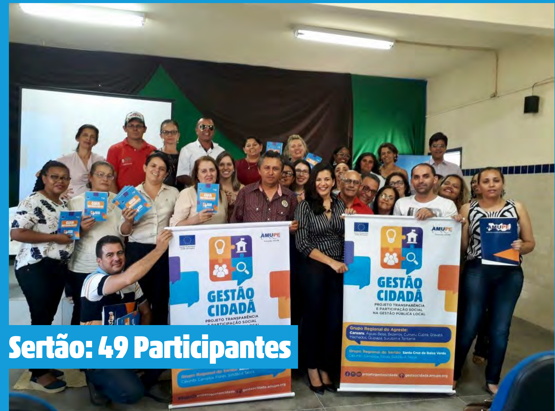
Sertão: 49 Participantes