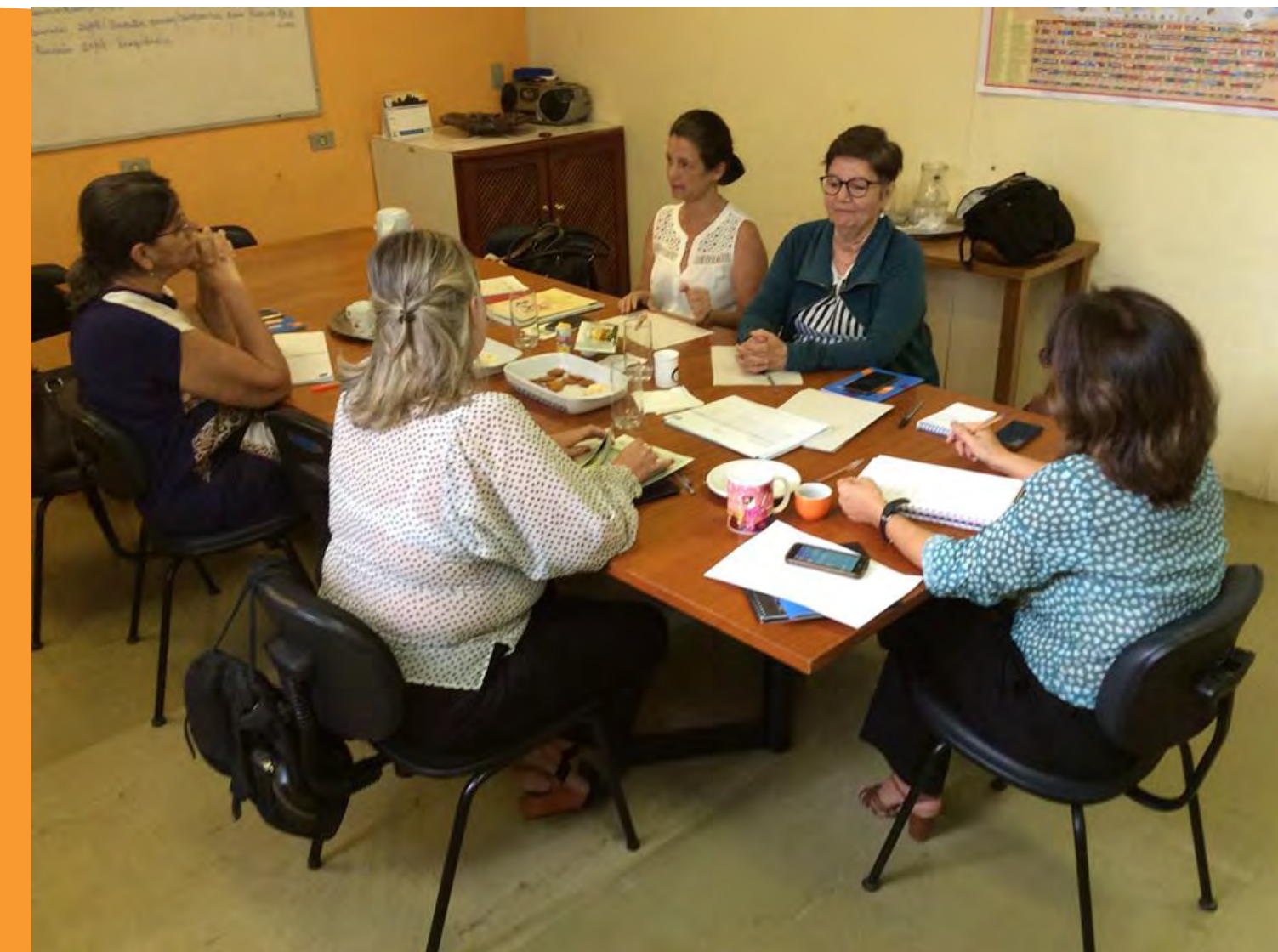
Agência Estadual de Planejamento e Pesquisas de Pernambuco (Condepe/Fidem) e o Núcleo de Saúde Pública e Desenvolvimento Social da Universidade Federal de Pernambuco (NUSP/UFPE)